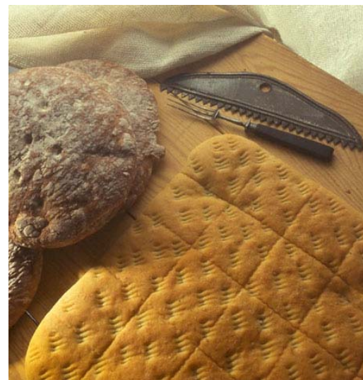
Näkkileipä Ohut leipä hapan- ja hiivaleipä- taikinasta