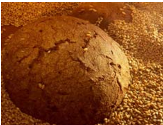
Varilimppu Hapanimelä ruisleipä juhliin